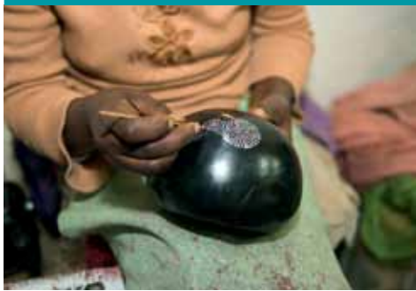
Beschilderen van paretshoen bij Muya.