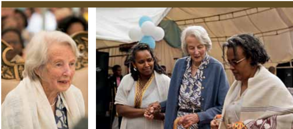
Catherine Hamlin, grondlegster Hamlin Fistula Hospital.