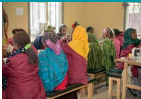
Entoto: sieraden maken.