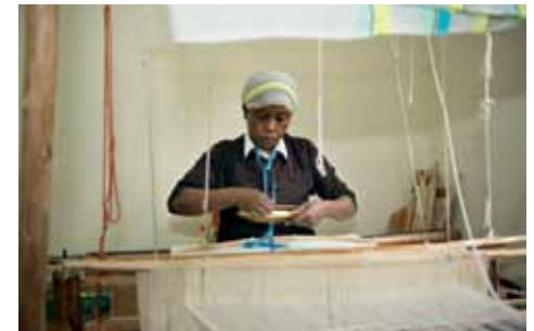
Weven van kleding bij Muya.