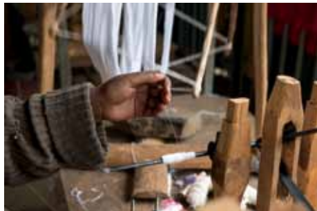
Spinnen bij Muya.