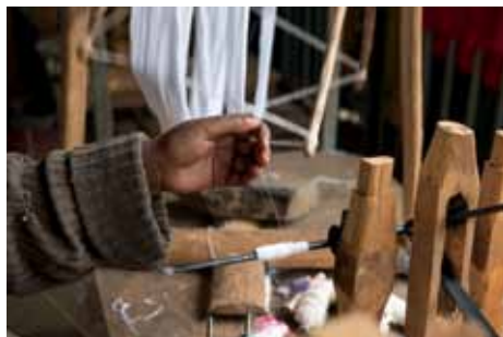
Spinnen bij Muya.